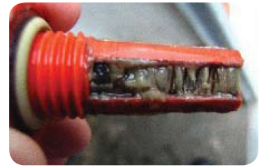
Nippel verstopt door biofilm

Biofilm is een oppervlaktelaag die wordt opgebouwd door micro-organismen in waterleidingen. In de veeteelt ontstaat er een ideale situatie om een versnelde groei van biofilm te creëren. Dit komt door het lage waterverbruik en de warme omgevingstemperatuur in een niet-steriele omgeving. Pathogenen ontwikkelen zich vaak in stilstaand water. Afzetting van kalk, ijzer en mangaan veroorzaken vaak nog meer problemen. Biofilm kan deze pathogenen opslaan en reduceert de efficiëntie van desinfectiemiddelen, medicatie en vaccinatie. Dit vergroot het risico op spijsverteringsproblemen en aandoeningen aan de luchtwegen dat resulteert in een verhoogde sterfte, een verminderde groei, een verhoogd aantal werkuren en een overbodig gebruik aan dure ontsmettingsmiddelen.