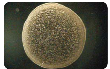
Met Aqua 4D® Regelmatige effen randen, gelijkmatige verdeling, neiging tot samenklonteren sterk gereduceerd