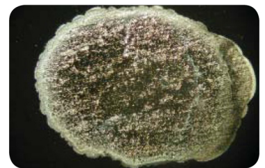
Zonder Aqua 4D® Onregelmatige randen, grove verdeling, neiging tot samenklonteren

Microscopische wateranalyse van hard water met 0.5 g/l penicilline